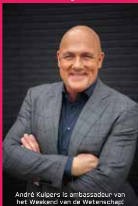
André Kuipers is ambassadeur van het Weekend van de Wetenschap!